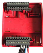
KL Xenta 4x/5x/9x