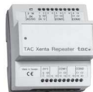
TAC LON REP

Universele klemmenstroken, montage: DIN rail, compatibele regelaars: XENTA 4xx / 3xx / 2xx / 5xx/ 9xx/ 1xx